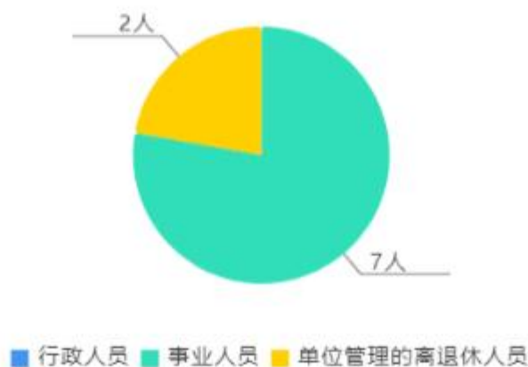
人员情况构成饼图