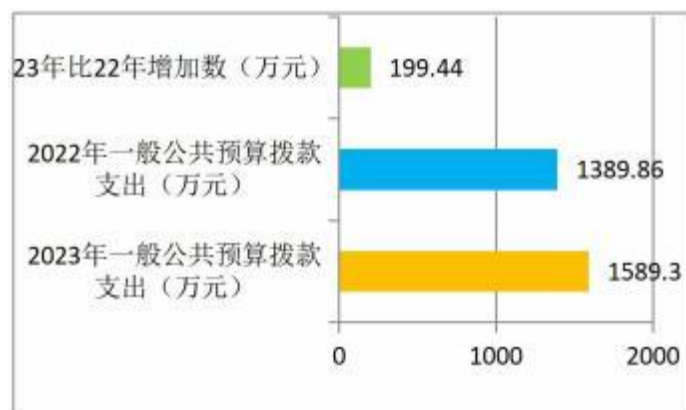
2023年一般公共预算拨款支出明细情况

2023年，本部门一般公共预算拨款支出 1589.3 万元，较上年增加 199.44 万元，主要原因是机构改革以后职能划转，项目增多，人员增加。