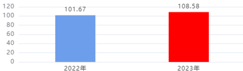
财政拨款收入、支出总计对比图（单位：万元）

2023年度财政拨款收入总计、支出总计均为108.58万元，与上年相比收入总计、支出总计均增加6.91万元，增长6.80%，增长的主要原因是：干部职工调资，人员台账支出增加，社会保障、卫生健康、医疗、住房保障支出随之增加。