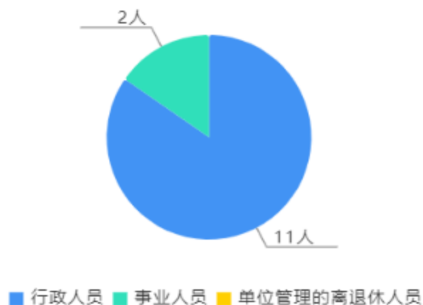
人员情况构成饼图