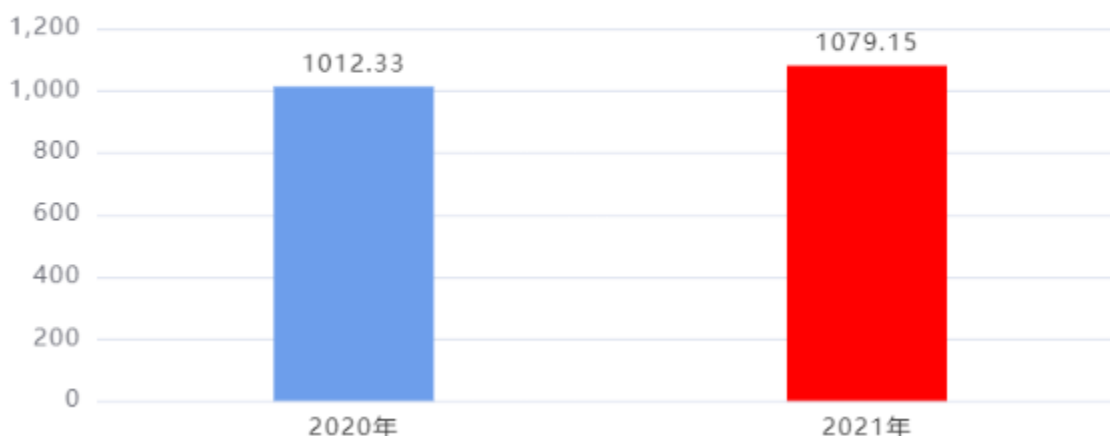
财政拨款支出对比图（单位：万元）

本年度财政拨款支出预算1,079.15万元，支出决算1,079.15万元，完成年初预算的100.00%，占本年支出合计的100.00%。与上年相比增加66.82万元，增长6.60%，增长的主要原因是：本年度大案要案查处费用、巡察工作费用等增加。